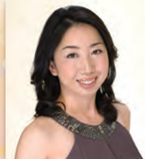
白石 愛子(メゾソプラノ)