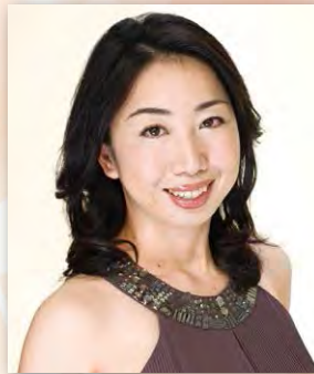
白石 愛子 (メゾソプラノ)